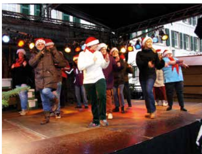
Auftritt Weihnachtsmarkt 2013

Selbstverständlich steht unsere Tür immer offen und neue Tänzer und Tänzerinnen sind !! Herzlich Willkommen !!