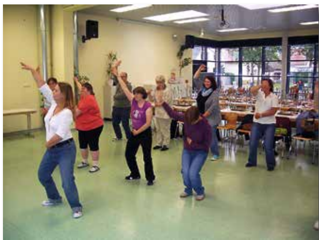
Übungsstunde in der Parkschule