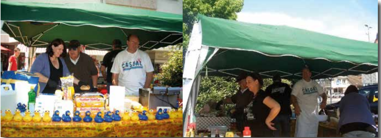
Spargelsonntag in der Rüsselsheimer Innenstadt