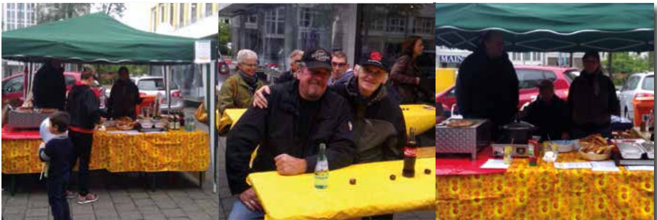
Verkaufsoffener Sonntag - Oktober